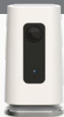
Caméras HD d'intérieur