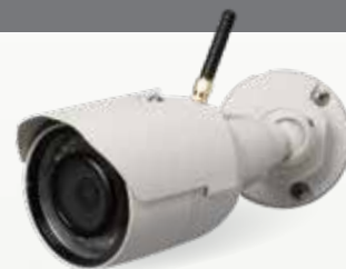
Caméra HD d'extérieur