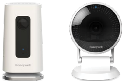
Caméras HD d'intérieur

Observez les visiteurs qui se présentent à votre porte, écoutez-les et parlez-leur, activez ou désactivez le système de sécurité, verrouillez ou déverrouillez la porte, le tout sur un même écran, grâce à l'utilisation de la sonnette vidéo intelligente.