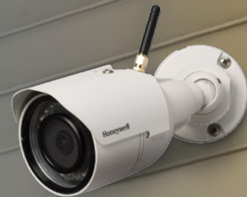
Caméra HD d'extérieur