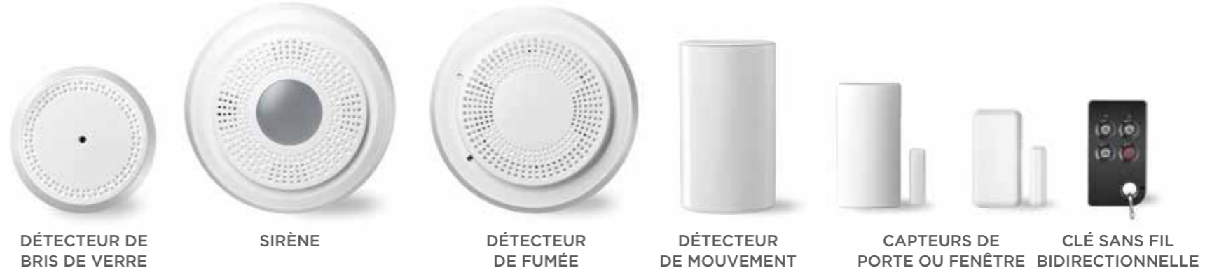
DÉTECTEUR DE BRIS DE VERRE