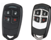
5834-4 5834-4EN Transmisor remoto inalámbrico de cuatro botones 3V, 210mAh*