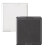
5870API-WH 5870API-GY Sensor de interiores para la protección de bienes CR2 (1)*