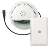
5877GDPK Equipo de control para puerta de garaje