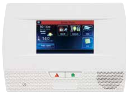
La température peut être réglée en degrés Celsius ou Fahrenheit.

Le centre de messagerie familial permet à chacun d'enregistrer et d'écouter des messages vocaux.