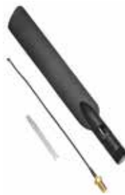
CELL-ANTHB (con piezas incluidas)