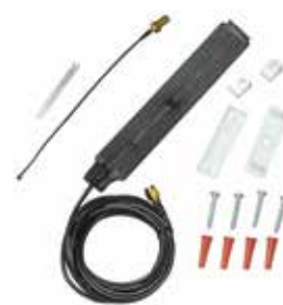
CELL-ANT (con piezas incluidas)