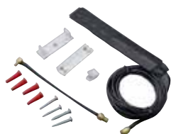
CELL-ANTRA (con piezas incluidas)