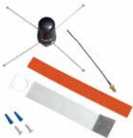
CELL-ANT3DB (con piezas incluidas)